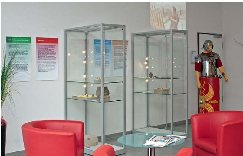
Abb. 1 Teil der Ausstellung im Business Center mit Vitrinen und Beamerprojektion.

Die für eine archäologische Ausstellung ungewöhnliche Situation im Business Center und die damit einhergehende Fokussierung auf die Kunden der diversen Institutionen innerhalb des Gebäudekomplexes als Zielpu-