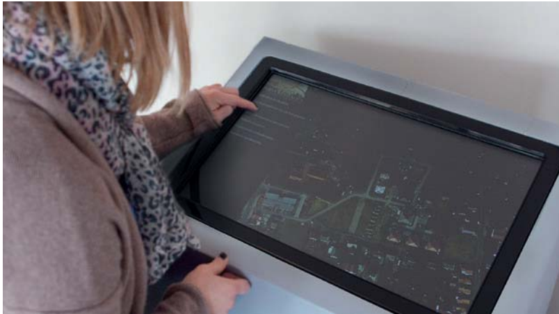
Abb. 4 Information am Touchscreen-Monitor.

Neben dem konservatorischen Aspekt besteht ein weiterer Vorteil des 3-D-Scanverfahrens in der hervorragenden Eignung des dreidimensionalen Computermodells für Präsentationen, etwa in Museen, bei Vorträgen oder im Internet. Durch Drehung des virtuellen Objekts ist ein Betrachten von allen Seiten möglich. Eventuell fehlende Teile lassen sich als Rekonstruktion ergänzen und Anima-